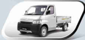
Classic Silver Metallic