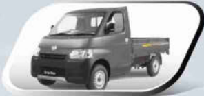
Rock Grey Metallic